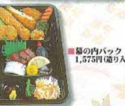
■幕の内バック 1,575円(送り入)